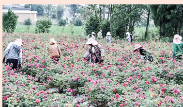
永安村各族群众在玫瑰花田中劳作