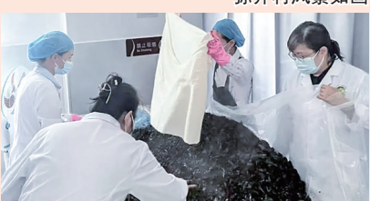
西双版纳州梯次化培养傣医药学科带头人