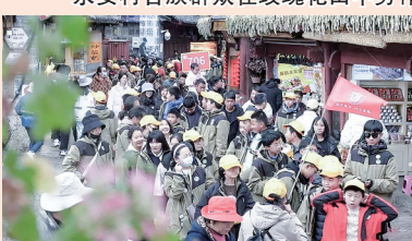
丽江掀起研学热潮