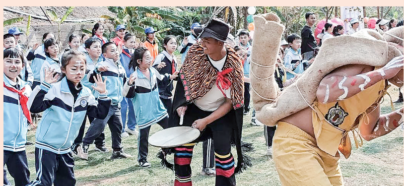
易门县创新“非遗+”研学实践