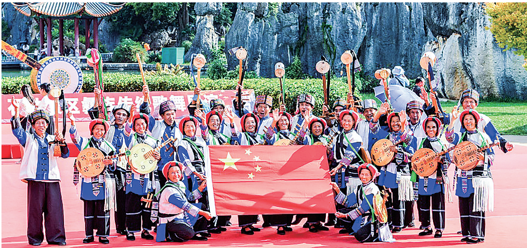
石林风景名胜景区表演引客来