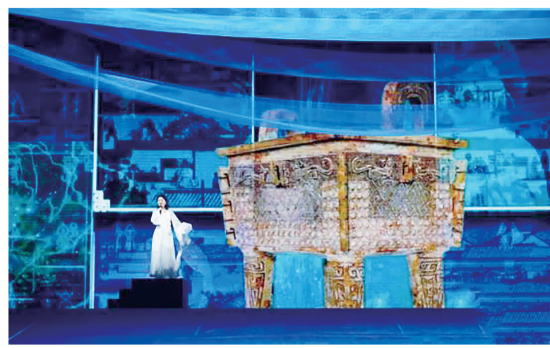
开幕式现场沿黄九省(区)文物精品展节目演出

续写黄河文明新篇章;沿黄九省(区)媒体代表随后上台启动“黄河之声”宣传矩阵。 随着中国(郑州)黄河文化月的开启,4月14日,辛丑年黄帝故里拜祖大典在郑州新郑举行。 “如果说黄河文化是中华民族之根与魂,那么黄帝文化就是华夏文明的第一道曙光。”知名学者郦波在当晚的演讲中说,“我们头枕黄河,拜祭黄帝,如此热爱这片土地,因为我们都是龙的传人”。 河南省委常委、郑州市委书记徐立毅表示,此番沿黄九省(区)黄河之约是传承弘扬黄河文化的有益探索,目的是要打造一个向世人展示黄河文化的平台,促进中华文明与世界文化交流互鉴,努力使其成为黄河流域生态保护和高质量发展的文化标识和战略支撑。 首届中国(郑州)黄河文化月从